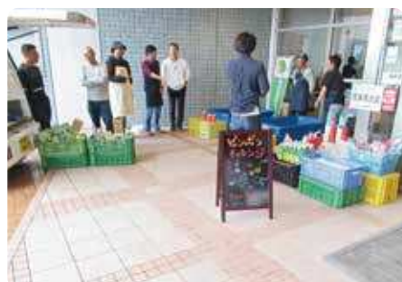
亀田郷産野菜販売