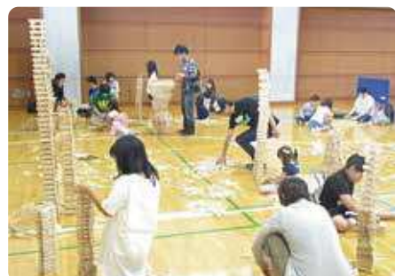
スポーツ広場でカブラ体験