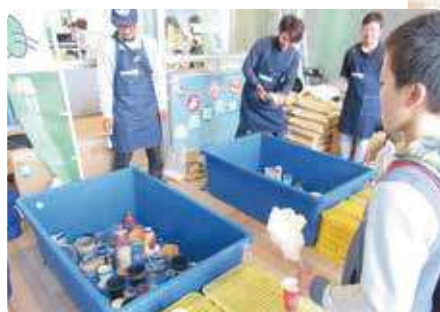
ピンポン玉入れゲーム