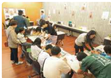
ストラップづくり