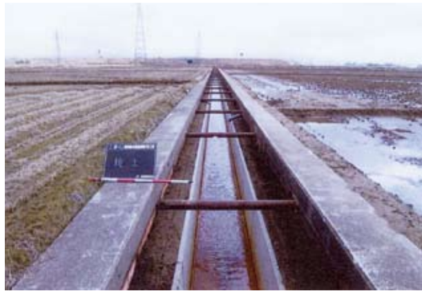
工 事 後